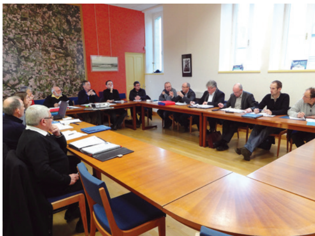
Bureau de CLE en décembre 2012

Ces travaux, comme toutes les autres actions conduites au SMEIL, sont désormais intégrés dans un tableau de bord, outil indispensable au suivi de la mise en œuvre du SAGE, qui doit guider la réflexion de la Commission Locale de l'Eau (CLE). Fruit d'informations issues des partenaires divers impliqués dans la