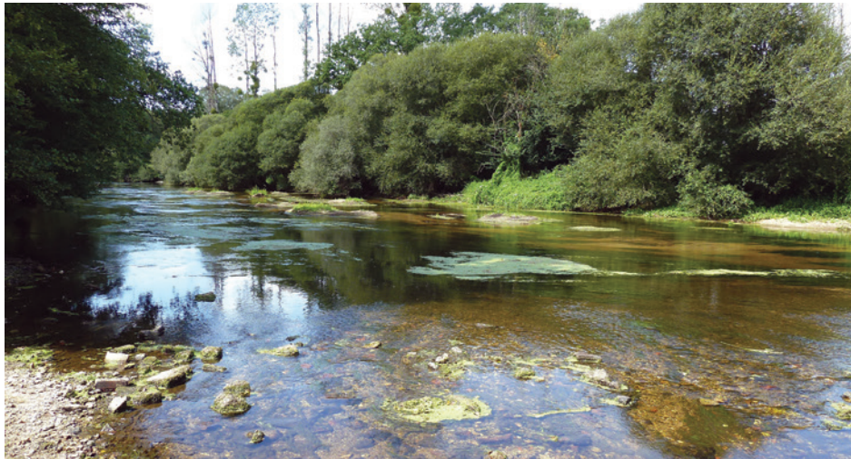
Ellé à Loge Coucou en août 2011

Le bassin versant Ellé-Isole-Laïta connaît périodiquement des difficultés d'approvisionnement en eau en période de très basses eaux, en particulier sur l'Ellé amont. En effet, plusieurs étiages plus ou moins sévères ont été enregistrés depuis une trentaine d'années, notamment 1989, 1997, 2003 ou encore 2010 et 2011.