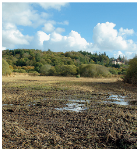
Fauche de la roselière sur les Guerns, en 2012

Sous maîtrise d'ouvrage de la ville de Quimperlé, le contrat Natura 2000 (2011-2015) sur les « Guerns » se poursuit avec l'appui du SMEIL et du coordinateur du site, Lorient Agglomération.