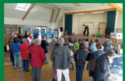
Ci-dessus : Le Saint - 26 et 27 octobre 2012