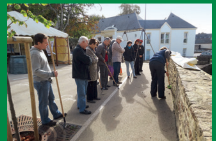
Ci-dessus : Quimperlé - 28 et 29 septembre 2012