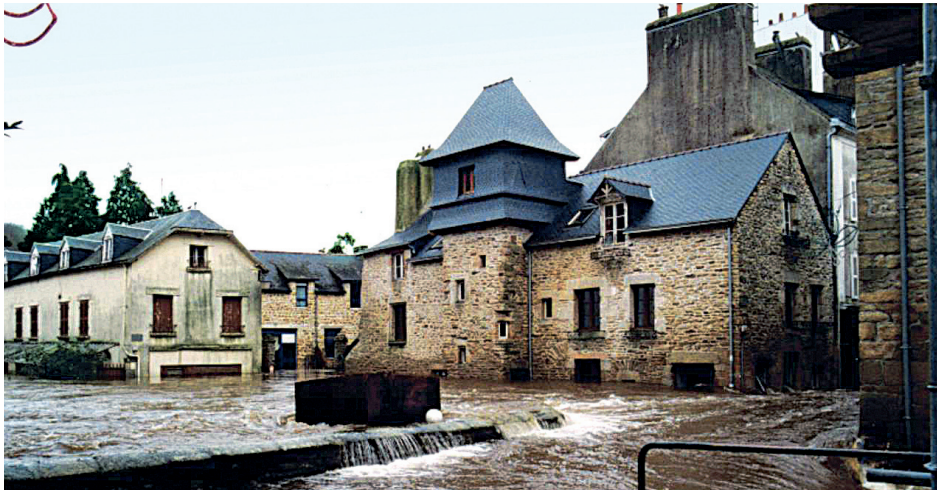
Les inondations de 2000-2001 à Quimperlé, au pont Salé

Le bassin versant a été sévèrement touché par les crues en 1995 et 2000 notamment au niveau de Quimperlé qui se trouve à la confluence des deux principaux cours d'eau, l'Ellé et l'Isole. Parmi les solutions envisagées, la Commission Locale de l'Eau a notamment choisi d'étudier la faisabilité d'une mise en place d'ouvrages de « ralentissement dynamique des crues ».