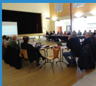
Commission Locale de l'Eau du SAGE Ellé-Isole-Laïta du 6 février 2015