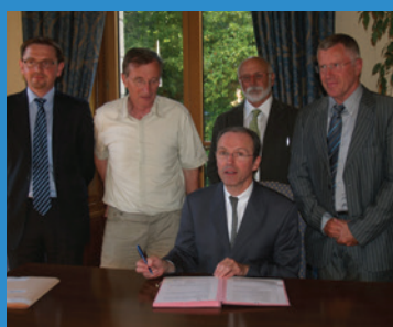
Signature du SAGE Ellé-Isole-Laïta, le 10 juillet 2009

CLE = Commission Locale de l'Eau DOCOb = DOcument d'Objectif (Natura 2000) EDL = État des lieux PAEC = Projet Agro-Environnemental et Climatique (porté sur l'Ellé-Isole-Laïta-Aven-Belon-Merrien) PAPI = Plan d'Actions et de Prévention des Inondations PASE = Programme d'Actions Stratégique pour l'Eau SAGE = Schéma d'Aménagement et de Gestion des Eaux