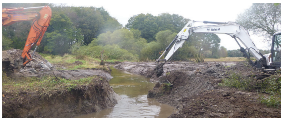
Mini pelles à l'œuvre pour recréer les méandres

*CTMA = Contrat Territorial Milieux Aquatiques