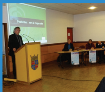
Conférence-débat sur l'eau en présence du sénateur-maire Joël LABBE, le 12 avril 2013