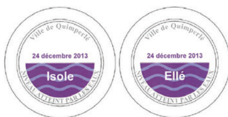
Macaron des repères de crue

De nombreux repères de crues sont déjà présents en basse-ville de Quimperlé pour la crue historique du 13 décembre 2000 ainsi que pour les crues historiques de 1925 et 1995. Pour compléter ce dispositif, la Ville de Quimperlé prévoit la pose de 4 nouveaux repères de crues, marquant les hauteurs atteintes pour l'événement du 24 décembre 2013. Ces nouveaux repères devraient être installés durant cet hiver 2020/2021.