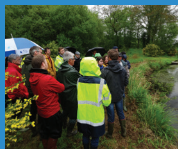
Rencontre des partenaires sur le terrain autour de différentes actions portées sur le bassin versant, le 17 mai 2017