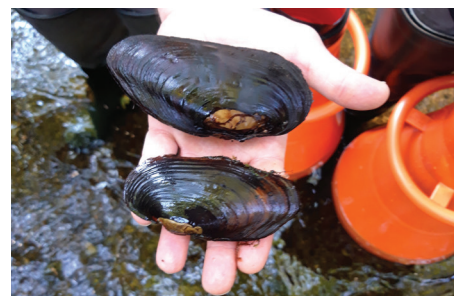
Coquille vide de Mulettes perlières

Dans le cadre de l'amélioration des connaissances des espèces présentes sur le site Natura 2000 Rivière Ellé, des prospections ont été menées en septembre 2020 en partenariat avec Bretagne Vivante pour rechercher la Mulette perlière sur l'Aër, dans des zones encore non étudiées. Ces 2 journées de terrain ont permis de parcourir 2,5 km de cours d'eau et d'identifier une douzaine de nouvelles Mulettes entre Garhirine et Pont Rouge au Croisty. Le coût de cette opération s'élève à 1 500 €, entièrement financé par l'État et l'Union Européenne (FEADER).