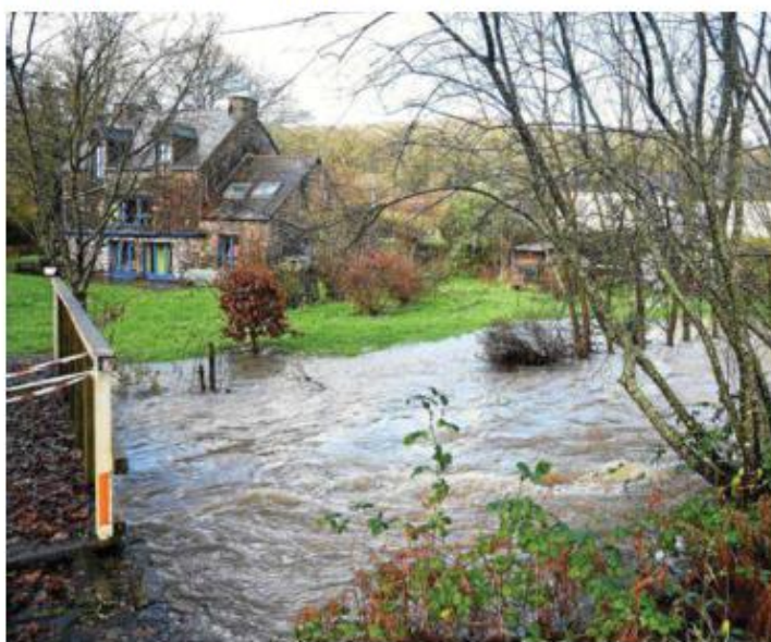
À Bon-Repos-sur-Blavet (22), le Daoulas est sorti de son lit et menace les habitations voisines.

Dans la liste : Odet, Laïta, Blavet, Vilaine aval, Oust, Vilaine médiane, Meu et le trio Trieux - Leff - Gouët. Ils n'étaient que six la veille. Outre la perturbation très active qui a abordé la région jeudi soir, samedi, une nouvelle onde pluvieuse active gagnera l'ouest du pays, prédit Météo France. Aucune amélioration n'est attendue à court terme, le risque d'inondation va perdurer au moins jusqu'à Noël, avance le site Météo Bretagne.