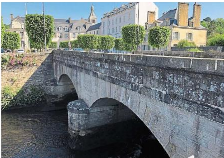
Le pont du Bourgneuf, au cœur d'une étude dans la lutte contre les inondations à Quimper.