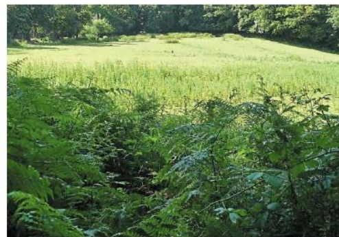
La partie haute du centre concernée par le projet d'extension du camping, qui nécessite 2,5 ha de bois. D'autres parties seront reboisées.