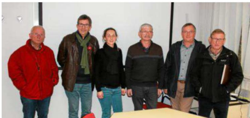
Des représentants de la Smeil, de Kemperle rando et d'Eau et rivières de Bretagne seront sur le parcours, dimanche, pour la randonnée.

En partenariat avec Kemperle rando et l'association Eau et rivières de Bretagne, l'événement doit permettre aux