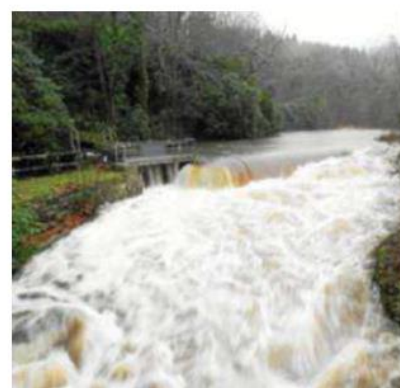
L'Isole au barrage de Cascadec, ce jeudi 19 décembre, à 11 h 30.

Pour information, les crues « historiques » ont eu lieu en décembre : 2,99 m le 16 décembre 2011 ;