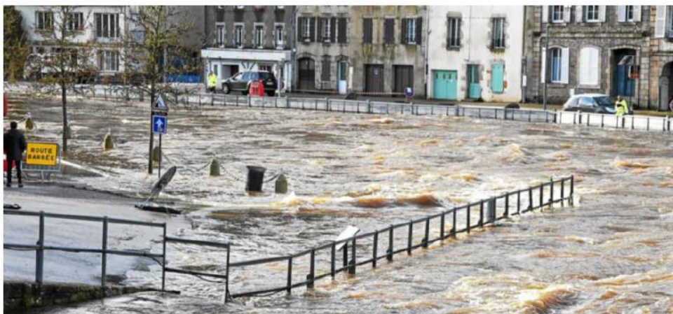
Ce 20 décembre 2019, la Laïta à Quimperlé est sortie de son lit mais les barrières destinées à lutter contre les inondations ont joué leur rôle.

Le risque d'inondation quai Brizeux, ce vendredi matin à Quimperlé, est passé. Mais la vigilance jaune de la Laïta est maintenue.