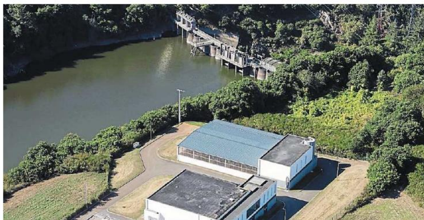
L'usine de traitement d'eau près du barrage de Rophémel situé à Guenroc (Côtes-d'Armor) sur La Rance.

La priorité du 11 e programme d'intervention 2019-2024, reste, comme pour le 10 e , la « reconquête du bon état des eaux ». C'est une obligation imposée par la Directive cadre de l'Union européenne : atteindre 100 % de « masses d'eau » en bon état en 2027. On en est loin : « Moins d'un tiers des cours d'eau sont en bon état », observe Martin Gutton, directeur général de l'Agence de l'eau Loire-Bretagne. Ce qui signifie que « la qualité ou la quantité d'eau sont insuffisantes pour assurer le bon fonctionnement des écosystèmes