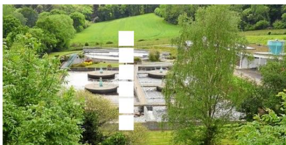
Le niveau de pollution de la Laïta doit être amélioré, en cause notamment les stations d'épuration.

Le niveau de pollution de la Laïta doit être amélioré. Le Douardu, le Froust, et deux stations d'épuration dégradent le milieu selon le bilan établi par la Commission locale de l'eau. Il va falloir investir pour atteindre une meilleure qualité.