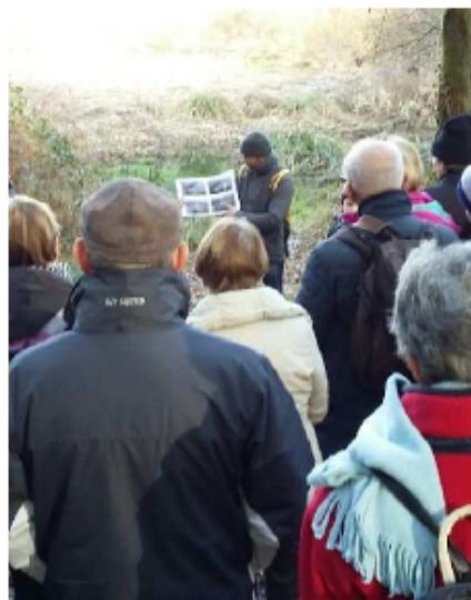
Les randonneurs ont pu profiter d'explications devant les guerns.

Les participants à la randonnée se sont montrés attentifs aux explications avant de rentrer par la forêt pour la petite boucle de 5,5 km ou par le chemin du roi, pour les plus coura-