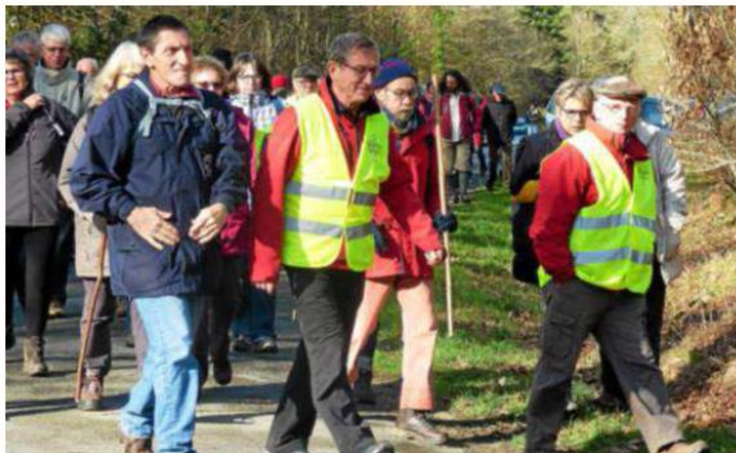
80 personnes ont participé à la randonnée, en forêt de Toulfoën.

C'est d'un pas décidé qu'au moins 80 personnes se sont lancées derrière Kemperle rando, Bretagne vivante, Eaux et rivières et le Syndicat mixte Ellé-Isole-Laïta (Smeil), montrant ainsi leur intérêt pour les zones humides de la forêt de Toulfoën, le samedi 2 février. Cette sortie mi-ludique mi-pédagogique, organisée dans le cadre de la Journée mondiale dédiée à ces réserves