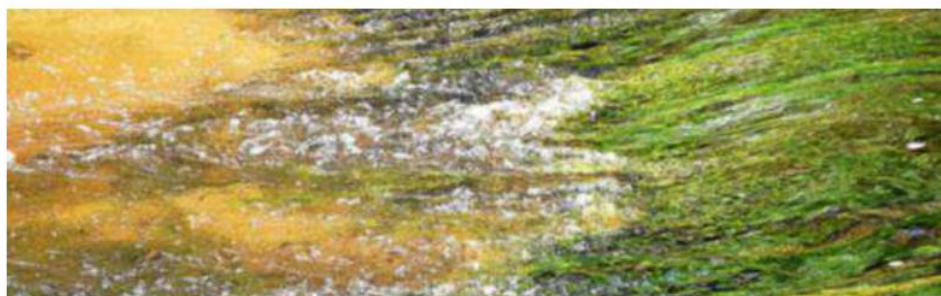
La réunion se déroule ce mardi à Priziac. Roland Fly

La réunion est organisée en deux temps. D'abord un point d'information sur ce qu'est un site Natura 2000 et sa traduction concrète pour les exploitants agricoles et dans un second temps le recueil des avis et remarques sur le