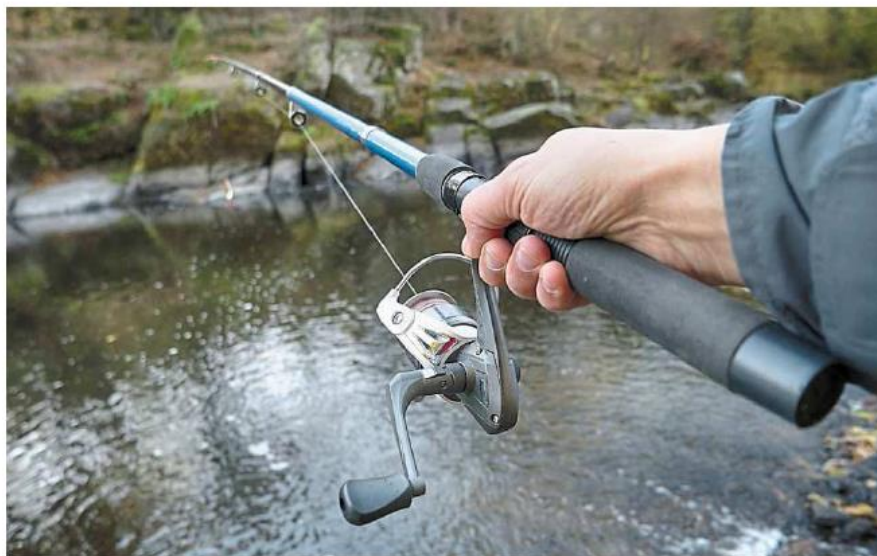
« Après des années porteuses d'espoir, la liste des maux dont pourraient souffrir nos rivières dans un proche avenir s'allonge », a alerté Jean-Yves Moelo.

En mettant des mots sur ces maux, Jean-Yves Moelo a voulu pointer du doigt les coups portés à l'environnement et, par extension, au loisir qu'est la pêche. Une manière aussi de mobiliser les troupes en cette année marquée par un dossier important, avec la révision du Plan départemental sur la gestion piscicole (PDPG), actuelle-