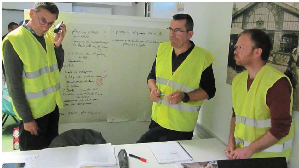
Les différents acteurs, dont de nombreux élus, ont été mis en situation de gestion de crise.