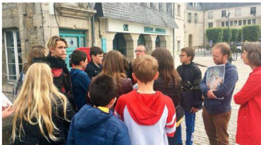
Les collégiens sur les rives de l'Isle.

Trois classes de 5 e du collège de Bannalec étaient sur les rives de l'Isole, à Quimperlé, ce lundi, pour une sensibilisation au risque inondation pilotée par le Smeil.