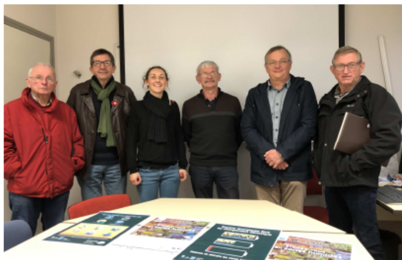
Les équipes du Smeil et de Kemperle rando et Eau & Rivières s'associent pour faire découvrir les zones humides lors d'une randonnée, dimanche, en forêt de Toulfoën.

Le Syndicat mixte Ellé-Isole-Laïta s'associe à Eau & rivières et Kemperle rando pour faire découvrir les guerns.