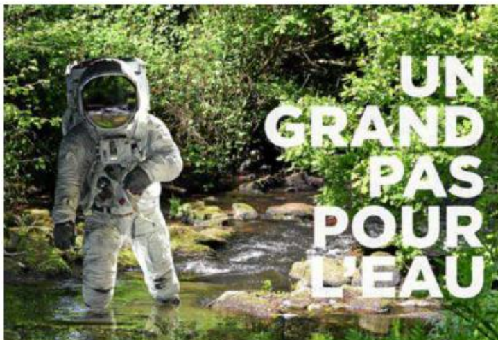
« Un grand pas pour l'eau ». C'est le titre de l'affiche des 50 ans d'Eau et rivières de Bretagne, lancée en 1969 sous le nom d'Association pour la promotion et la protection des salmonidés en Bretagne, APPSB.

« Un grand pas pour l'eau » : l'association Eau et rivières de Bretagne propose un clin d'œil à la conquête spatiale pour promouvoir la fête qui marquera, les 25, 26 et 27 octobre à Quimperlé, les 50 ans de l'association. C'est en effet en 1969, alors que Neil Armstrong posait le pied sur notre satellite, que Jean-Claude Pierre et Pierre Phélipot lançaient la conquête de l'eau.