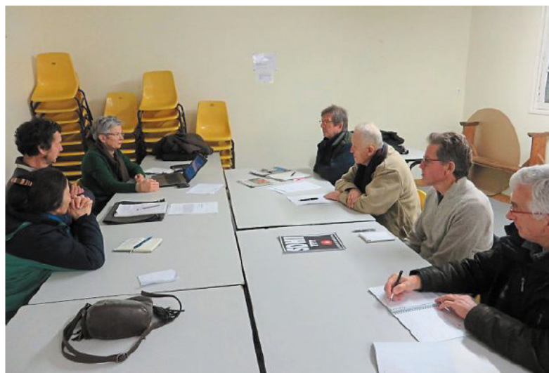
Les adhérents d'Eau et rivières de Bretagne ont fait le point sur l'actualité environnementale du pays de Quimperlé.

Comme tous les trimestres, les adhérents d'Eau et rivières de Bretagne se sont réunis, mercredi à la salle du stade, à Tréméven.