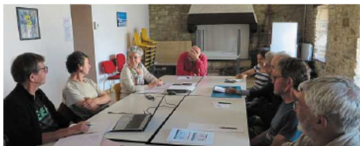
Les adhérents de l'association Eau et rivières du Bassin Ellé-Isle-Laïta suivent attentivement certains dossiers

Fin octobre, Eau et Rivières de Bretagne fêtera son 50 e anniversaire à Quimper, où l'association a vu le jour.