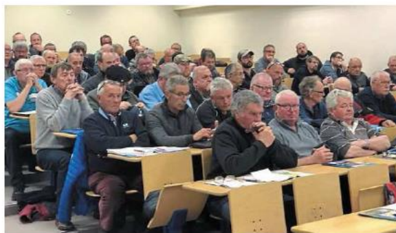
Près de 80 personnes ont suivi l'assemblée générale de l'AAPMA.