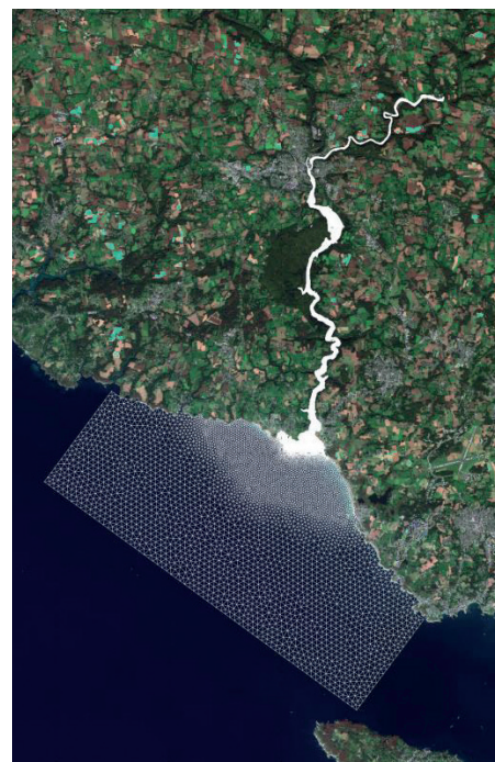
Emprise du modèle hydraulique élaboré

Curage de la Laïta définitivement écarté