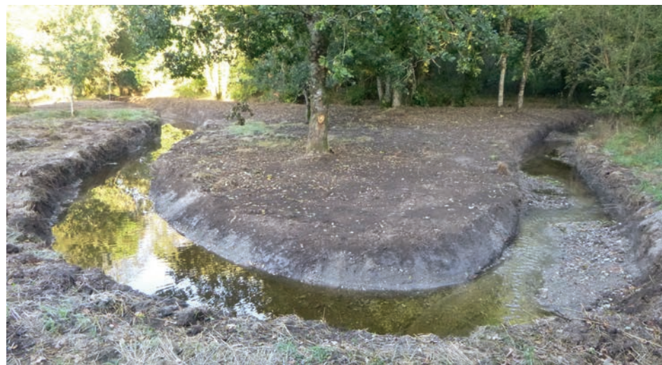
Mise en eau d'un nouveau méandre sur le Langonnet

Les chantiers de restauration hydromorphologique se poursuivent dans le cadre du CTMA* porté par Roi Morvan Communauté. En septembre dernier, sur le