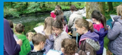
École publique de Plouray, le 22 mai 2015