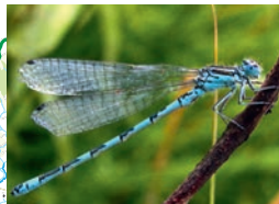
Agrion de mercure

12 ESPÈCES ET 10 HABITATS D'INTÉRÊT COMMUNAUTAIRE