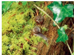
Escargot de Quimper