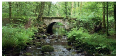
Le Frouit, affluent de la Laïta, au pont de Pierre

Dépourvus de programme de restauration des milieux aquatiques, les bassins versant du Naïc et de la Laïta ont bénéficié à l'été 2016 d'un diagnostic de leurs cours d'eau, conduit par Quimperlé Communauté. Objectif : atteindre et préserver le bon état écologique des milieux aquatiques !