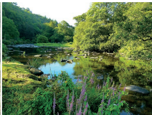
L'Isolé à St Thurien, Moulin Richet