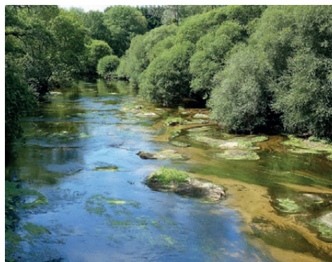
L'Ellé à Lanvéneën, Loge Coucou