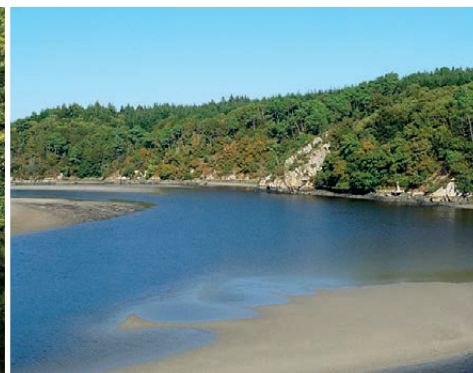
L'estuaire de la Laita